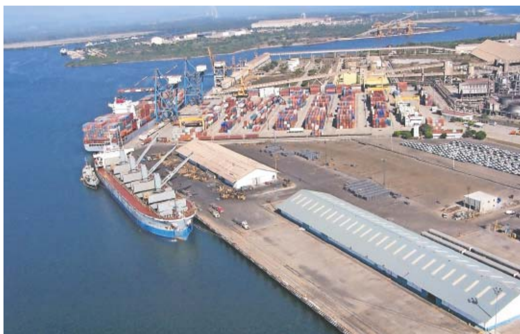
El Puerto de Lázaro Cárdenas, Michoacán, es uno de los más importantes del país.

Entre las riquezas del pacífico michoacano hay esteros, caletas, peñascos, playas ideales para el surf y refugios para diversas especies animales y vegetales que hicieron de éste su hábitat más preciado, porque casi todos ellos aún son considerados espacios vírgenes. ●