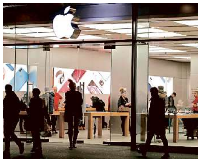
La firma Canalys calcula que los envíos de iPhones disminuirán 3 por ciento para este año.

El volumen de producción previsto para los iPhones nuevos y viejos se reducirá probablemente a un rango de entre 40 y 43 millones de unidades para enero-marzo, frente a una proyección previa de 47 y 48 millones de unidades, reportó Nikkei, citando una fuente cercana.