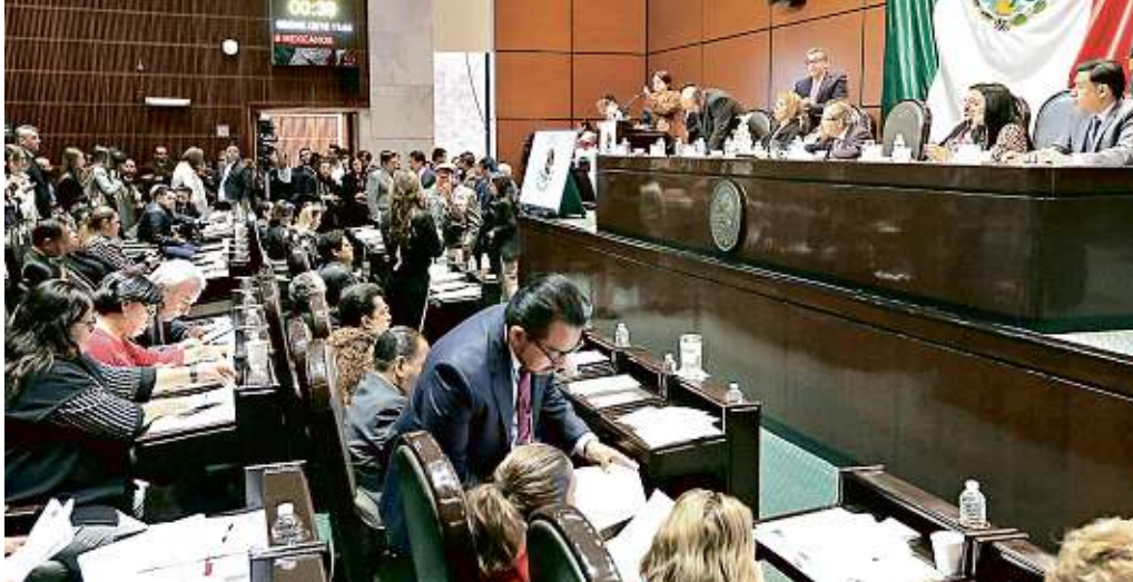
La iniciativa de Morena iba a ser presentada en la sesión de ayer en San Lázaro, pero al final se bajó de la orden del día.

De acuerdo con el proyecto, el director de Pemex asumirá directamente la facultad de conducción central y estratégica de la empresa, sus subsidiarias y compañías filiales, así como de cualquier empresa donde Pemex tenga directa o indirectamente